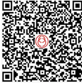
第三届高职项目团队